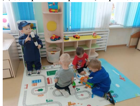
Игра «За рулём»