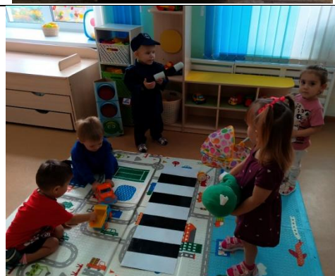
Дид.игра «Осторожно, переход!»

4 «Неделя безопасности дорожного движения» с 23.09. по 27.09.2024 г.