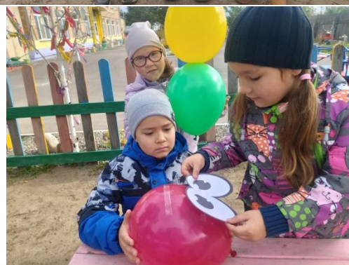
Конструирование «Воздушный светофор»