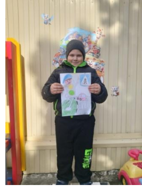
Конкурс рисунков на тему ПДД

3 Уголки «Безопасность дорожного движения»