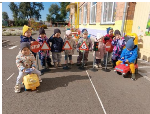
Игровое упражнение «Игра со знаками»