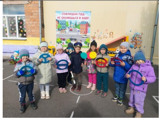
Викторина «Внимание перекрёсток»